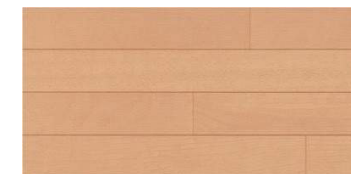
ナチュラルバーチ