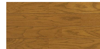
エクセルミディアム