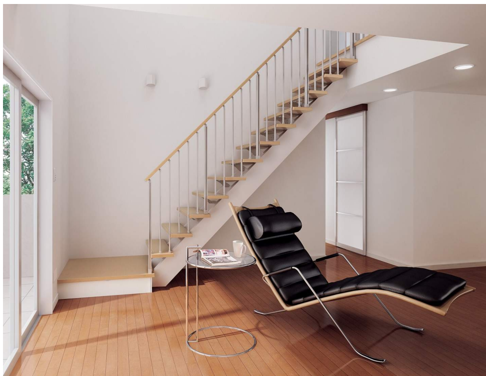
※イメージ写真のため実際とは異なる場合がございます。