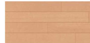
ナチュラルバーチ